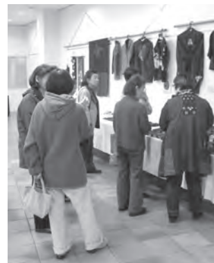
前回の末広和顔会展（作品発表会）の風景