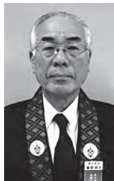
本願寺派門徒宗会議員（長照寺総代・同門信徒会副会長）