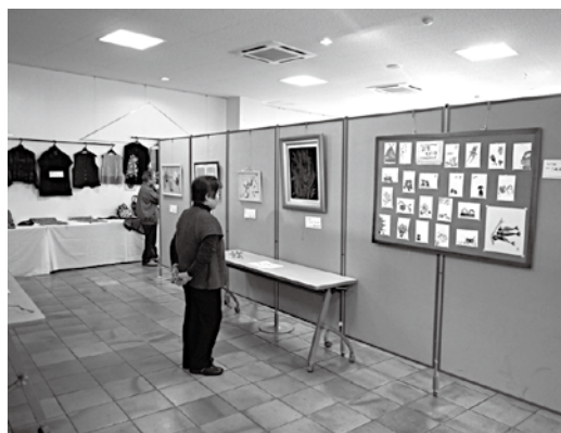
前回の末広和顔展(作品発表会)風景