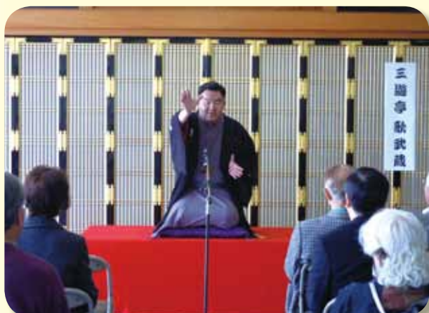
花まつり・落語の会 (平成24年4月8日) 三遊亭 歌武蔵 師匠