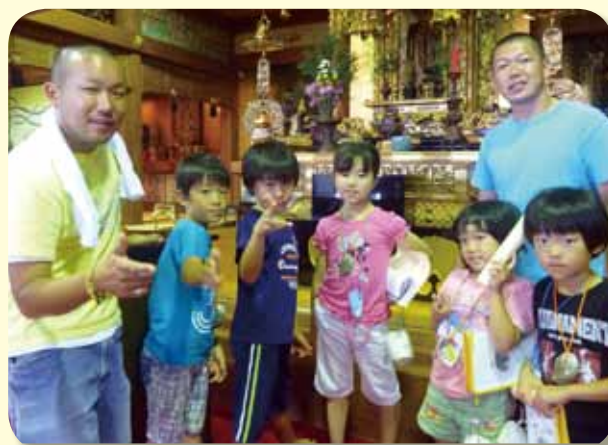
お寺の臨海学校 (南ブロック門徒子弟研修会) (平成24年7月26日~28日)