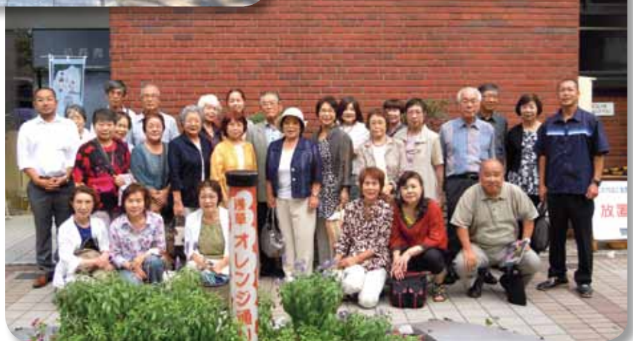
門信徒会親睦一日研修旅行 創作劇 「親鸞 わが心のアジャセ」 平成24年9月1日

「人が何の苦勞もしないで徳を得る。その最上のことは、 弥陀を信じておまかせするだけで仏になるということである。 これ以上のことはない。」