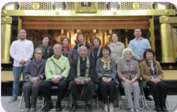
門信徒会親睦研修旅行 2018年10月31日～11月2日 名古屋別院