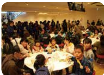
クッブヌードルミュージアム