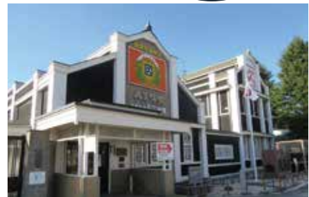
八丁味噌の里見学