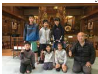
長照寺本堂で 出発・到着のあいさつ