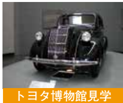
トヨタ博物館見学