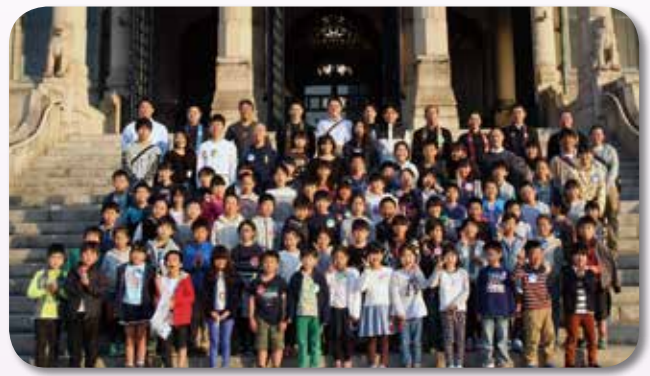
つきじ1泊(わんぱく)子ども会 2019年3月26日～27日 築地本願寺