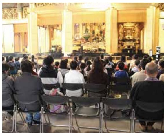
朝のお参り (晨朝勤行参拝)