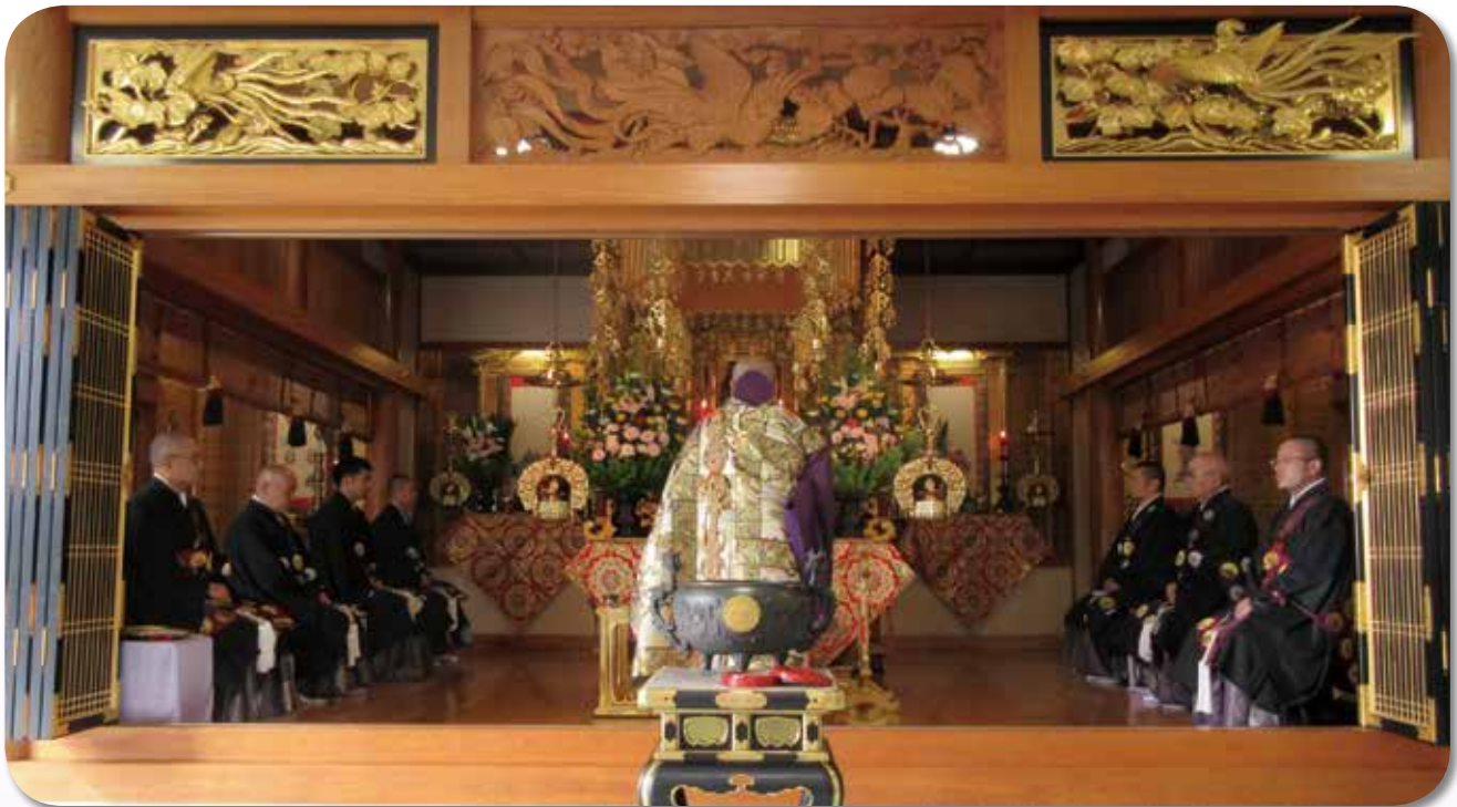
報恩講・長照寺建立三十周年記念二法要 2018年11月18日

浄土真宗本願寺派(西本願寺) 撰取山 長照寺 静岡県三島市徳倉1195-817 電話055-988-4242 URL http://cyoshoji.or.jp E-mail: info@cyoshoji.or.jp