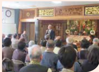
前総代の顕彰および新総代の紹介をいたしました