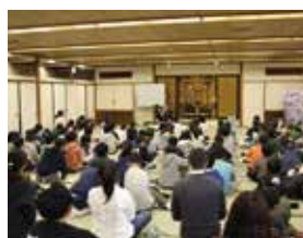
ほとけさまのお話

仏様のおはなし・班対抗ゲーム大会・ 日進カップヌードルミュージアム見学等、 盛りだくさんの内容を楽しんできました。