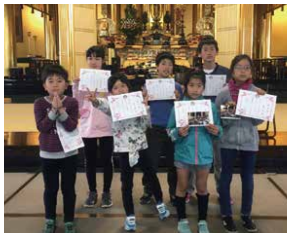
長照寺よりの参加者